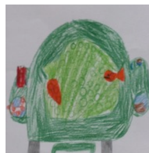
Samen met kat en konijnstoel 1

Verhalen (reflectie op eigen werk) van kinderen: filmpje 5 minuten