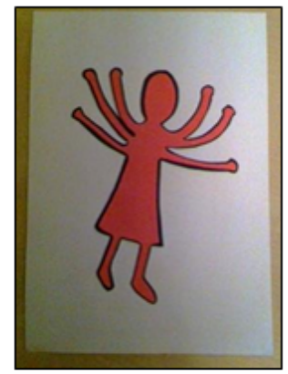
Oplakken wit A4