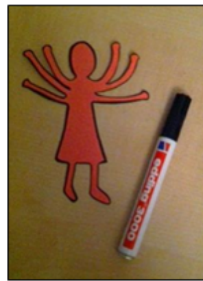
Personage omdraaien en contourlijnen trekken